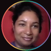
Zohora Phirbai Comunidade Ismaili de Lisboa